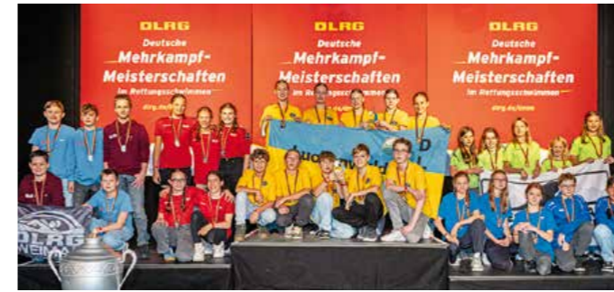
Siegerpodeste der Mannschaftswettbewerbe der Altersklasse 12 (li) auf Platz 2 und 13/14 (re) auf Platz 3 mit den Schwimmern aus Weimar.