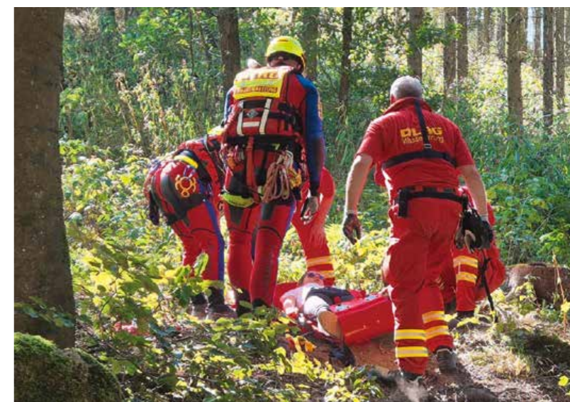
Bilder: oben und oben rechts: Rettungshunde der Feuerwehr Arnstedt werden in einem DLRG Rettungsboot transportiert. unten: Strömungsretter der DLRG versorgen eine verletzte Person in einem Übungsszenario.