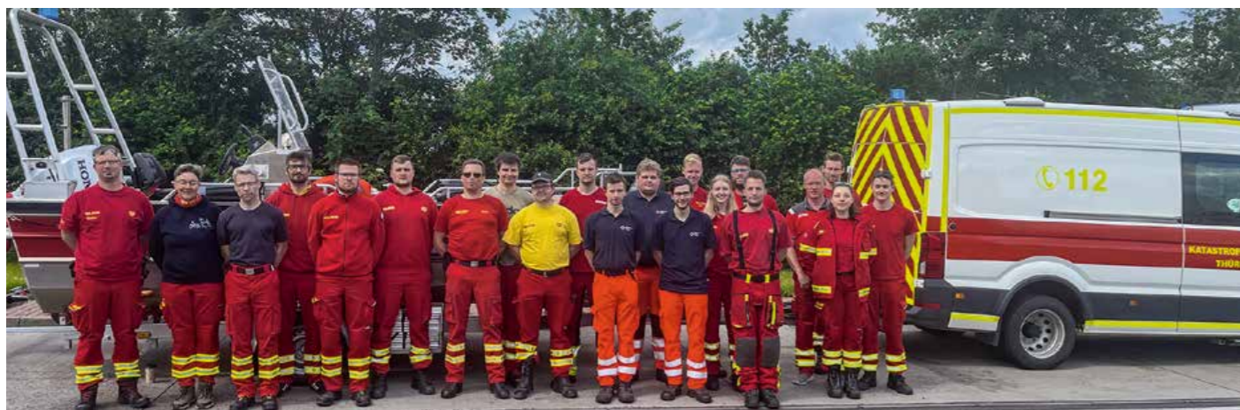
Bilder: Der Wasserrettungszug des DLRG Landesverbandes Thüringen in Bayern.

Der DLRG Wasserrettungszug besteht aus drei Wasserrettungsstaffeln, die in Eisenach-Gotha, Jena und Weimar stationiert sind. Alle drei waren mit Personal und Material in Bayern im Einsatz.