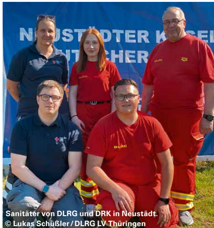
Sanitäter von DLRG und DRK in Neustädt.

Ein besonderes Erlebnis für alle Anwesenden war, auf Nico Kappel, Olympiasieger im Para-Kugelstoßen, zu treffen.