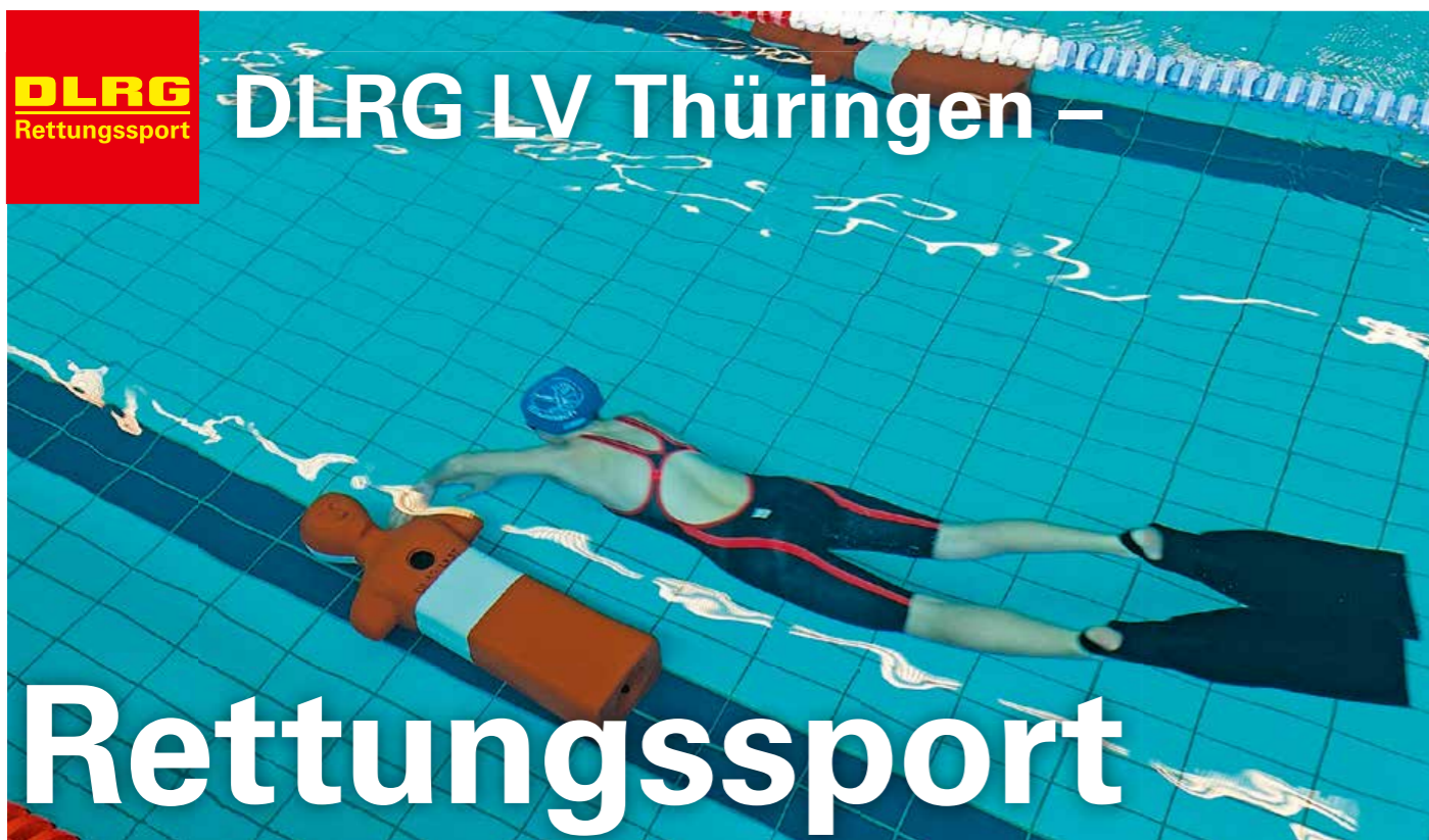
Aufnahme einer Rettungspuppe in der Disziplin 50 Meter Retten einer Puppe mit Flossen.

Der Rettungssport ist die Wettkampfvariante des Rettungsschwimmens. Er entstand aus der Idee heraus, Menschen für den Wasserrettungsdienst zu gewinnen. Denn gute Rettungssportler sind auch gute Rettungsschwimmer. Der Sport kann im Ernstfall helfen, Leben zu retten. Gleichzeitig können durch ihn Techniken zur Rettung verfeinert und perfektioniert werden. Kraft, Kondition, Schnelligkeit und die Beherrschung der Rettungsgeräte sind Voraussetzung dafür, im Wettbewerb