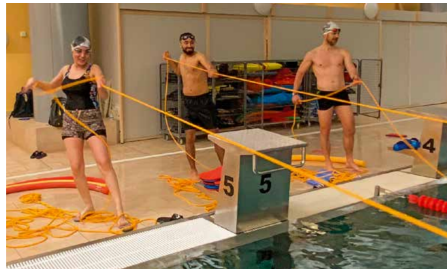
Bild rechts: Rettungsschwimmtraining der gemischten Erwachsenenschwimmgruppe im Eisenacher Aquaplex.

„Darf ich bei Ihnen Schwimmen lernen?“ Diese Frage stellte Ismael Saeed höflich, aber mit Verzweiflung in der Stimme Ende 2023 in der Eisenacher Schwimmhalle. Daraus entwickelte sich der erste integrative Schwimmkurs der Eisenacher. Der seitdem stetig unter hohem Zuspruch fortgeführt wird.