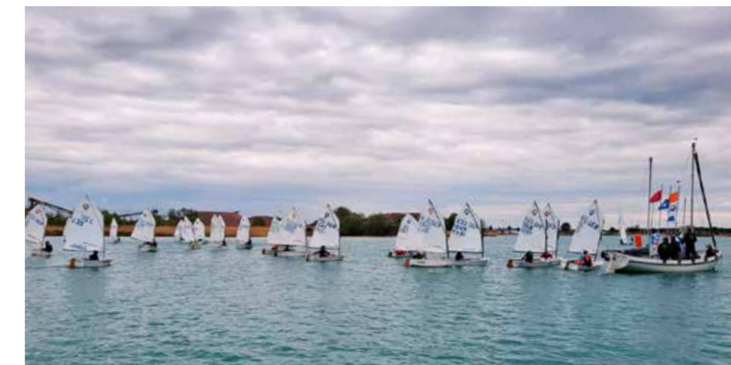
Segelboote der Klasse OPTIs am Start.

Für die wasser- und sanitätsseitige Sicherheit der Sportler*innen aus ganz Deutschland sorgte die DLRG Ortsgruppe Weimar mit sechs Einsatzkräften und zwei Motorrettungsbooten (MRB).