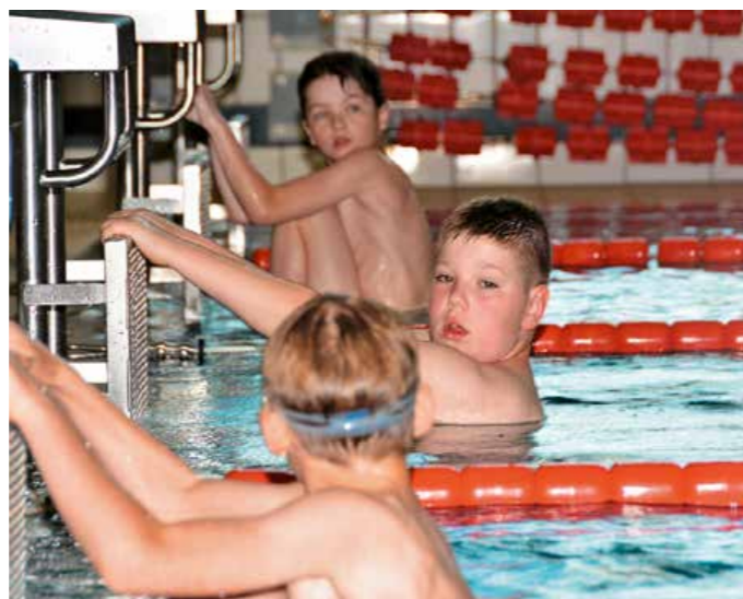
Start eines Schwimmwettkampfes bei den Kreisjugendspielen Saalfeld/Rudolstadt.