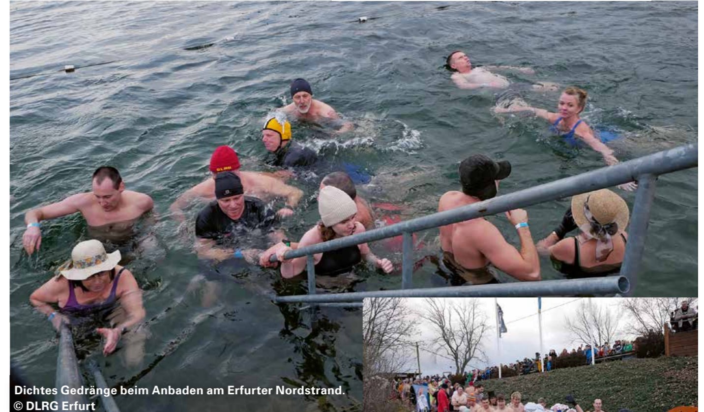
Dichtes Gedränge beim Anbaden am Erfurter Nordstrand.

In Erfurt wurde das Jahr 2024 zünftig mit dem Anbaden am Nordstrand eröffnet. Bei nur 5 Grad Celsius Wassertemperatur stürzten sich am Neujahrstag 164 Wasserratten von klein bis groß in das kalte Nass, bestens abgesichert durch die starke Sanitätsmannschaft der Erfurter.