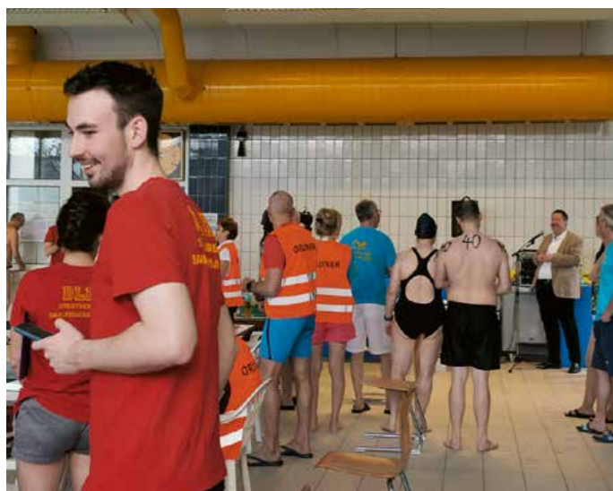
Impression vom 2. Saalfelder 12-Stunden-Schwimmen.

Erneut war es ein großer Erfolg und fand viel Anklang. Zusätzlich richteten sie die Schwimmwettkämpfe der Kreisjugendspiele Saalfeld/ Rudolstadt aus.