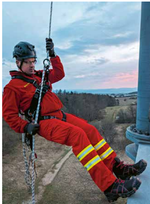
Bilder: Wasserretter beim Abseilen vom Gothaer Bürgerturm.

Angelehnt an den amerikanischen Swiftwater Rescue Technician (SRT) ist der DLRG-Strömungsretter (SR) ein auf stark strömende Gewässer, Wildwasser und Hochwasser spezialisierter Wasserretter. Er wird grundsätzlich im Team eingesetzt und ist durch eine spezielle Schutzausrüstung vor den besonderen Gefahren in Flüssen und Überschwemmungsgebieten geschützt.