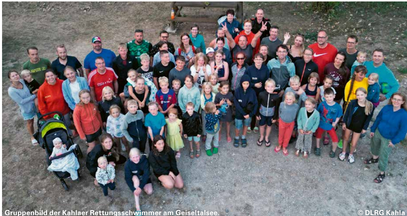
Gruppenbild der Kahlaer Rettungsschwimmer am Geiseltalsee.

Wie auch schon die vergangenen Jahre, ging es im August 2024 für die DLRG Ortsgruppe Kahla e.V. zum Geiseltalsee ins Trainingslager. 2024 konnten sie mit 73 Teilnehmern erneut einen Rekord verbuchen.