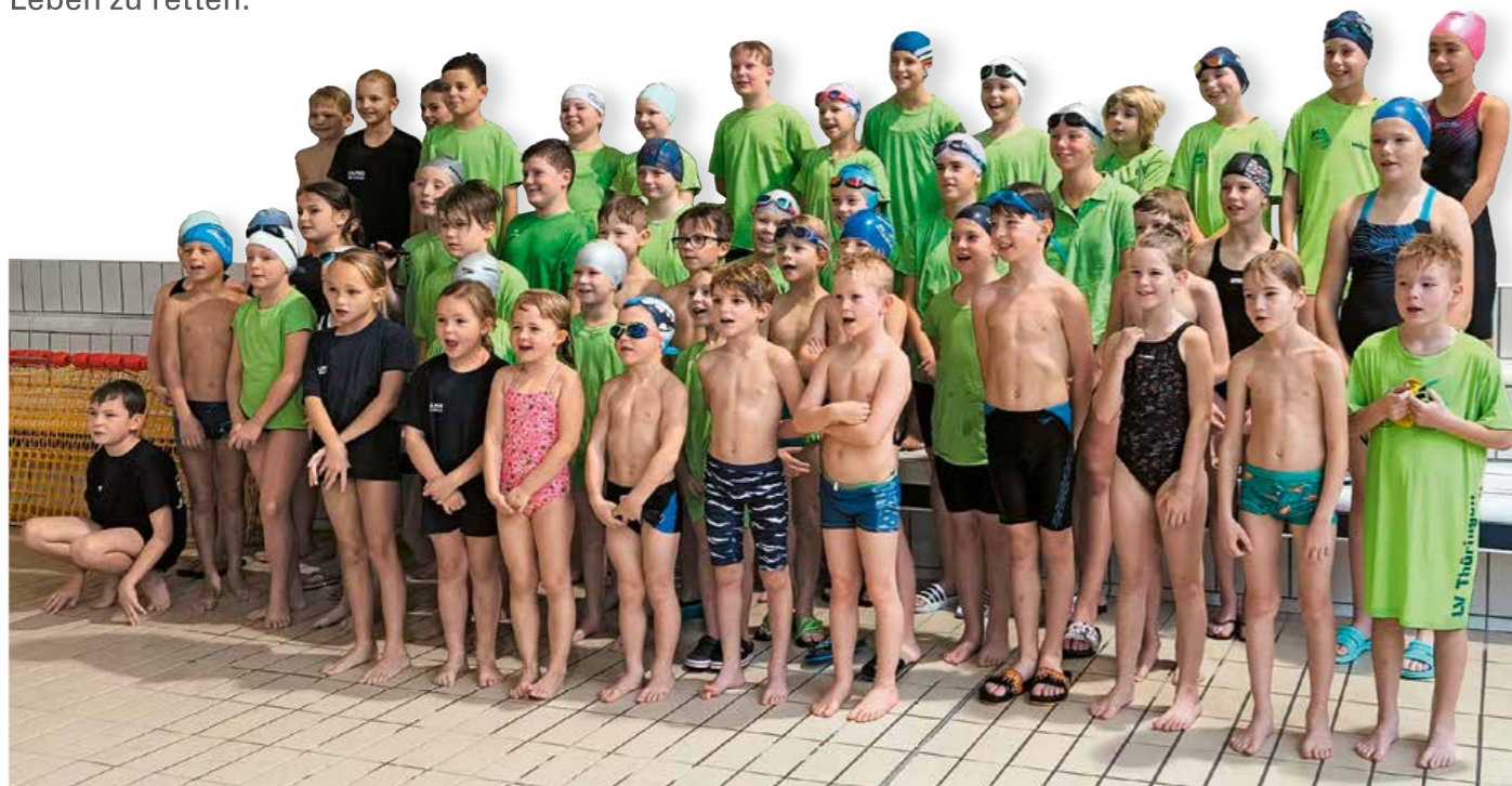
Die Thüringer Nachwuchs-Rettungssportmannschaft in Sömmerda.

Der Rettungssport bereitet die Aktiven unter anderem für den Einsatz vor. Erfolgreiche Sportler sind auch gute Rettungsschwimmer. Wie wichtig die Rettungsschwimmausbildung ist, zeigt zum Beispiel die Ertrinkungsstatistik der DLRG. Im letzten Jahr sind in deutschen Gewässern mindestens 378 Menschen ertrunken!