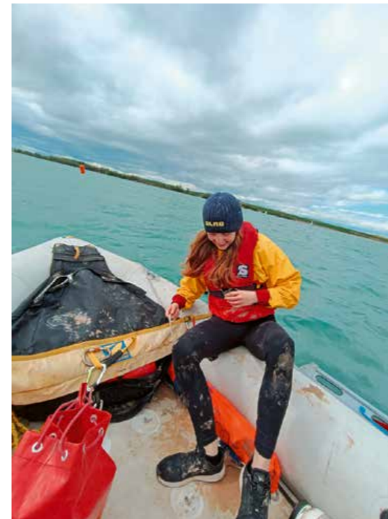
Jette Weiß nach technischer Hilfeleistung eines durchgekehrten Segelboots.

Mit einem neuen Teilnehmer*innenrekord lud der Club Mari4m Erfurt am 04.05 und 05.05.2024 zum 24. Thüringer OPTI -Cup an den Alperstedter See ein.