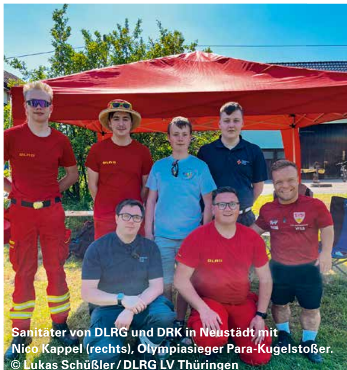
Sanitäter von DLRG und DRK in Neustädt mit Nico Kappel (rechts), Olympiasieger Para-Kugelstoßer.

Während der erste Tag unter anderem mit einem Simson-Treffen und der feierlichen Eiweiung des Steinparks auch der Unterhaltung diente, stand der Sonntag vordergründig im Zeichen des Sports. Die Stoßwettbewerbe sind Bestandteil des Deutschen Wurf-Cups. Die Athleten hatten die Chance, sich mit einem guten Ergebnis für die Europameisterschaft Mitte Juni in Rom zu qualifizieren.